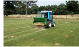
Abb.5: Besandung der Rasenparzellen