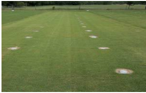
Abb.3: Rasenparzellen Tiefschnitteignung