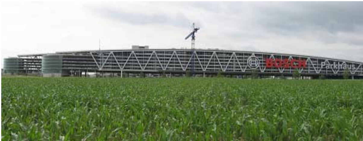
Abb.: 1 Das zweifingerige Parkhaus der Neuen Messe Stuttgart, geplant als Landschaftsbrücke über die Autobahn A8 zwischen dem Messe-/Flughafenareal und der Gemarkung Plieningen

Die Region Stuttgart ist gekennzeichnet durch moderne Industrie und in den Grenzgebieten von Stadt zur ländlichen Umgebung durch intensive Landwirtschaft mit einem hohen Anteil an Feldgemüsebau, begünstigt durch sehr gute Böden (Filder-Lößlehm) und die klimatischen Verhältnisse (Jahresniederschlag: 650 mm, Jahres-Durchschnitts-Temp.: 10°C). Durch den stetig wachsenden Flughafen Stuttgart und zusätzlich durch den Bau der Neuen Messe Stuttgart mit U-Bahn und geplanter ICE-Anbindung wurden innerhalb kürzester Zeit enorme Flächen der Landwirtschaft und der Ökologie entzogen. Im Planfeststellungsverfahren Landesmesse wurden von der Naturschutzbehörde Ausgleichsmaßnahmen gefordert, die im näheren Bereich nicht zu realisieren waren. Deshalb sollte das Dach des Parkhauses (ca. 1,8 ha), welches die Autobahn A8 überspannt, als ein Teil der Ausgleichsflächen für die bauliche Flächennutzung verwendet werden.