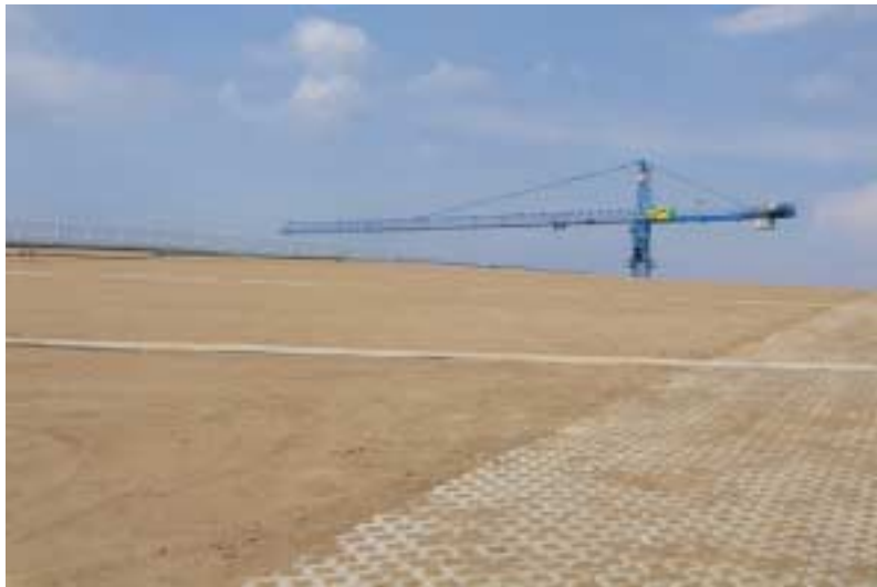
Fertig eingebautes Substrat auf der ersten Teilfläche vor der Ansaat Juni 2008

Durch bauliche Verzögerungen wurde die Ansaat beider Parkhausdächer 2008 realisiert. Die Begrünung erfolgte nach den aufgestellten Vorgaben im Anspritzverfahren mit der kräuterreichen Saatgutmischung. Im weiteren Verlauf wird nun der Erfolg der Dachbegrünung auf dem Extremstandort durch Pflanzenbestandsaufnahmen und wissenschaftliche Betreuung der Etablierungspflege durch die Rasen-Fachstelle der Universität Hohenheim überprüft. Über den weiteren Verlauf der Dachbegrünung wird berichtet.