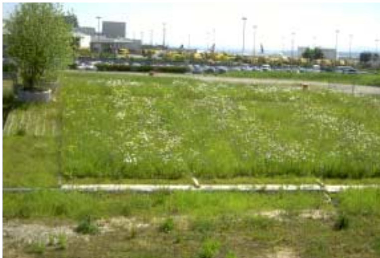
Vegetationsentwicklung und Blühaspekt Mai 2005, Gräserreiche und kräuterreiche Versuchspartellen im Wechsel

Die Ansaat erfolgte im September 2003 im Anspritzverfahren mit 4 g bzw. 3 g Saatgut pro m 2 . Das Anspritzfluidum enthielt zusätzlich zerspante Strohfasern, Baumwollfaser, organische Kleber, organischen Dünger und Bentonit in üblichen Mengen.